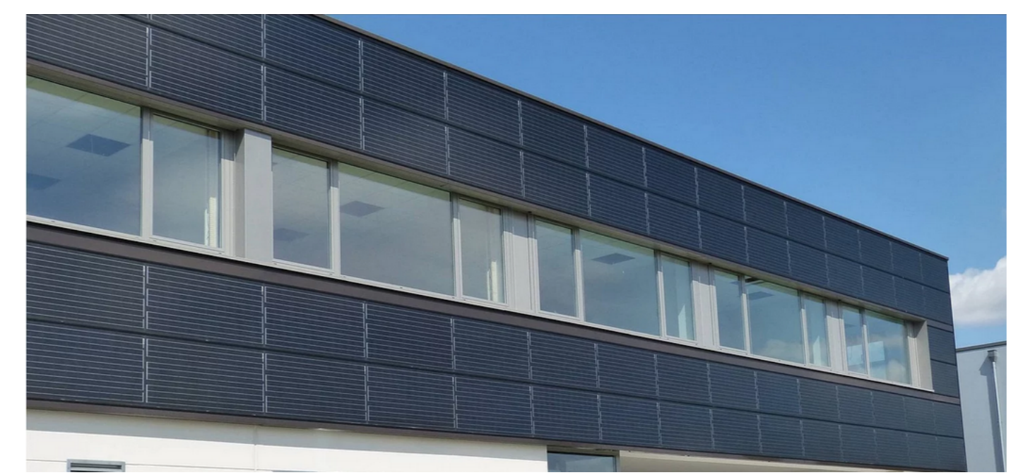
Beispiel Fassade PV