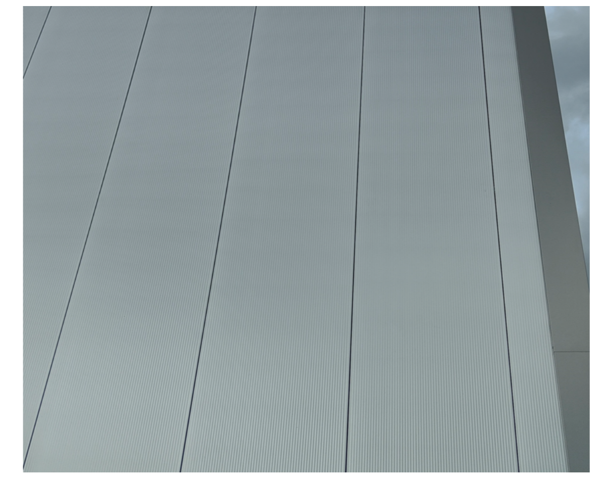
Beispiel Fassade RAL 9006