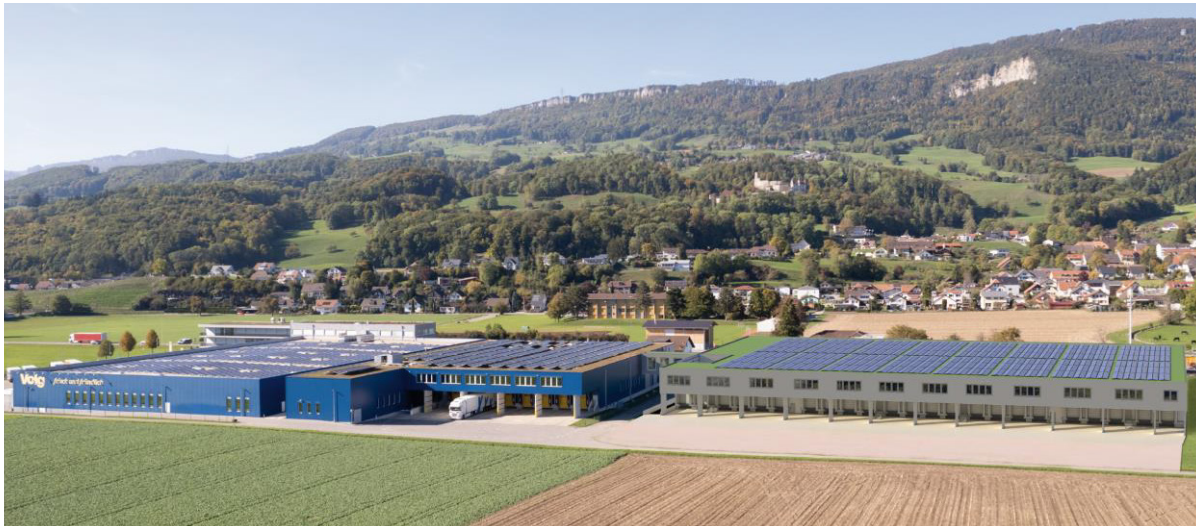
Abbildung: Fotomontage bestehendes Areal mit Neubau